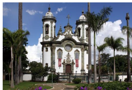
São João del Rei : Église São Francisco de Assis

4 ème jour Tiradentes – São João del Rei : Trajet vers São João del Rei, une autre ville aurifère du XVIII ème siècle. Tour des cités minières. Tiradentes, premier lieu d'établissement d'une communauté lors de la découverte des mines d'or.