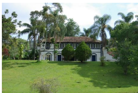
Ferme de café

2 ème jour Parati – Barra do Pirai – Visite de fermes (XVII ème et XVIII ème siècle) connues pour leurs plantations de café.