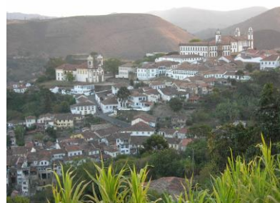
Ouro Preto : ville historique

6 ème jour Ouro Preto : Tour à travers les étroites ruelles de cette splendide cité coloniale baroque, inscrite au Patrimoine mondial par l'UNESCO.