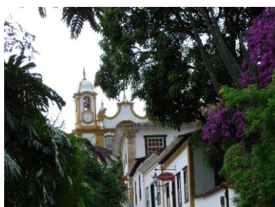
Tiradentes : patrimoine mondial de l'humanité

3 ème jour Barra do Pirai – Tiradentes : Via la vallée de Paraíba avec des fermes anciennes. Un voyage à travers la diversité culturelle, l'histoire et la gastronomie.