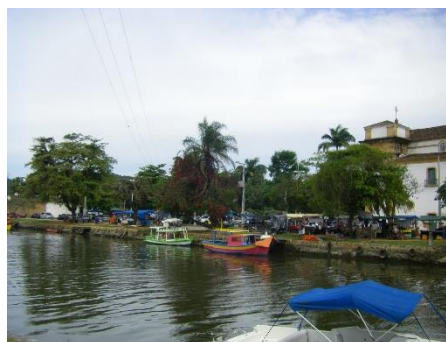
Parati, ville coloniale

4 ème jour Rio de Janeiro – Parati : Superbe trajet par la route, en longeant le littoral et côtoyant une nature exubérante, jusqu'à Parati, une merveilleuse bourgade en bordure de mer où les petites maisons colorées, bordant des ruelles aux imposants pavés disjoints, dégagent un charme fou. De nombreux commerces et de bons restaurants complètent l'image idyllique de ce lieu historique.