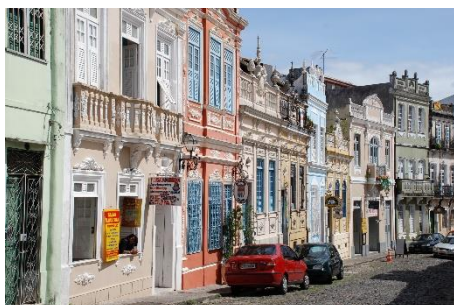
Salvador : quartier du Pelourinho

7 ème jour Salvador : Un tour de ville de Salvador d'une demi-journée vous permettra, notamment, de découvrir l'ancien quartier pittoresque et animé du Pelourinho, riche en témoignages artistiques religieux et coloniaux, ainsi que le célèbre ascenseur Lacerda qui mène de la ville haute au quartier du port et du marché couvert.