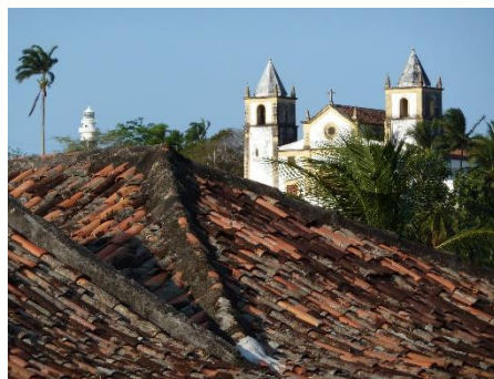
Olinda: Museu do Mamulengo

Vous admirerez également ses fameuses plages. Dans les environs de Recife, Olinda, inscrite au patrimoine mondial de l'UNESCO, ses rues tortueuses et pentues, ses nombreux édifices religieux et ses petites maisons colorées, offre un spectacle qui ne laisse personne indifférent.