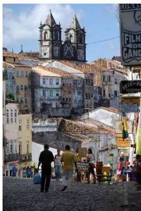
Salvador : quartier du Pelourinho

6 ème jour Parati – Rio - Salvador : Retour à Rio de Janeiro pour prendre un vol à destination de Salvador de Bahia.