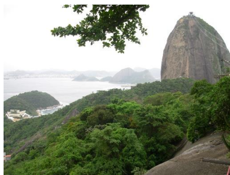
Rio de Janeiro: le Pain de Sucre

3 ème jour Rio de Janeiro : journée libre. La ville offre de très nombreuses attractions que vous pourrez découvrir à votre rythme. Possibilité également de s'inscrire à des excursions facultatives, comme, par exemple, dans les environs de Rio, les îles tropicales proches de la côte.