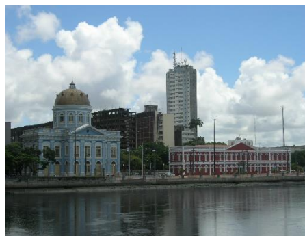
Recife: Assemblée législative

8 ème jour Salvador - Recife : Vol de Salvador de Bahia à destination de Recife, la capitale de l'Etat du Pernambuco.