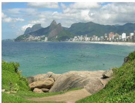
Rio de Janeiro, Arpoador

2 ème jour Rio de Janeiro : Via la dense végétation de la forêt pluviale de Tijuca, trajet jusqu'à la statue du Christ Rédempteur offrant une vue fantastique sur Rio. Tour de ville et excursion au célèbre Pain de Sucre, haut de 440 mètres. La vue sur la ville, les plages et les îles voisines y est spectaculaire.